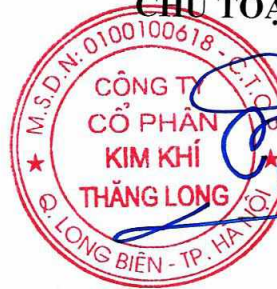
PHẠM HỮU HÙNG